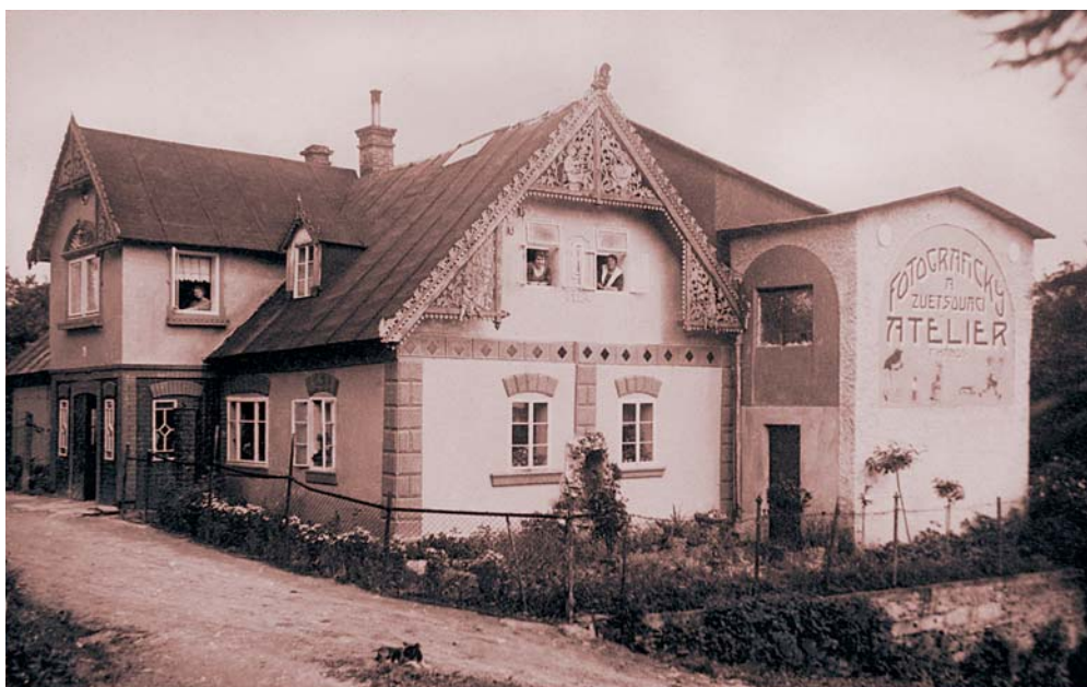
F. Hanuš: Dům s fotoateliérem F. Hanuše ve Vysokém nad Jizerou, kolem 1899. (Archiv P. Scheuflera.)

Rozvoj turismu na přelomu 19. a 20. století vedl nejen k postupné proměně života na horách a vnějším proměnám mnohých horských stavení, ale také ke zvýšenému zájmu fotografů. Přibývalo zejména autorů anonymních. Novým fenoménem doby, propojujícím