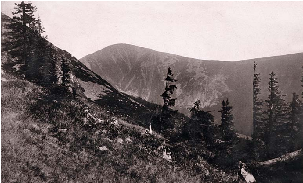
J. Eckert: „Sněžka od Studniční hory“, 1883–1884, kabinetka. (Archiv P. Scheuflera.)

kovně využít rostoucí zájem o fotografické snímky Krkonoš, a zcela jistě posledním velkým vydavatelem krkonošských kabinetek, tedy originálů fotografických snímků nalepených na kartonech.