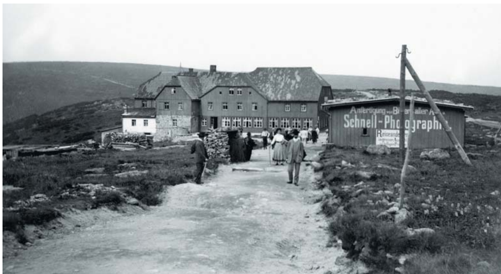
Neznámý autor: Nejvýše položený fotoateliér v českých zemích stával u Obří boudy, 1909. (Archiv P. Scheuflera.)

Technologické proměny, k nimž došlo ve fotografii v průběhu druhé poloviny 80. let 19. století, umožnily živé a bezprostřední fotografování a podnítily i rozmach fotografo-