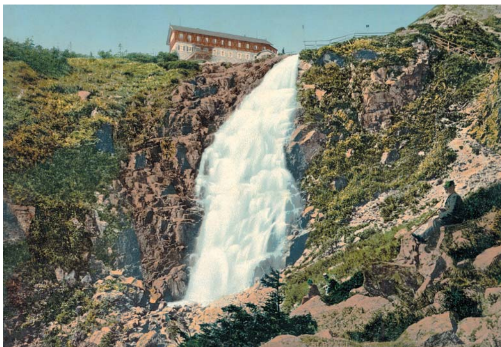
Nenke & Ostermaier: Labský vodopád, kolem 1900, photochrom.

Vedle pohlednic se záběry z Krkonoš tiskem šířily také v obrazových publikacích, jejichž rozmach souvisel s pokrokem tiskařských technik. Náměty z Krkonoš samozřejmě nechybí v nejvelkorysejším českém fotografic-