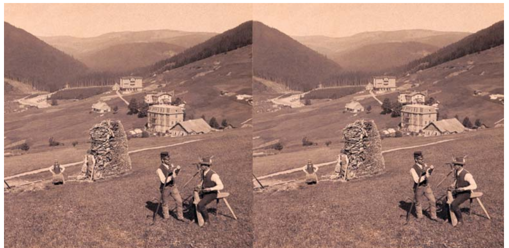
F. Krátký: Práce rolníků u Špindlerova mlýna, kolem 1889, stereofotografie. (Archiv P. Scheuflera.)