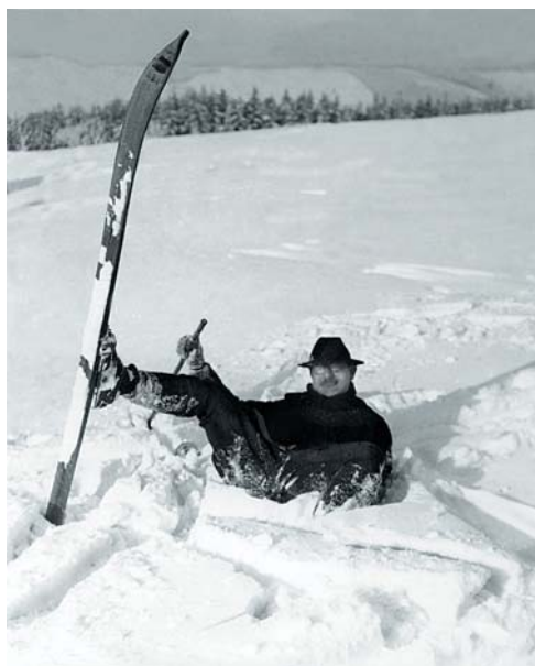
Lyžníci ve Vysokém nad Jizerou 1. února 1903, otištěno v Českém světě