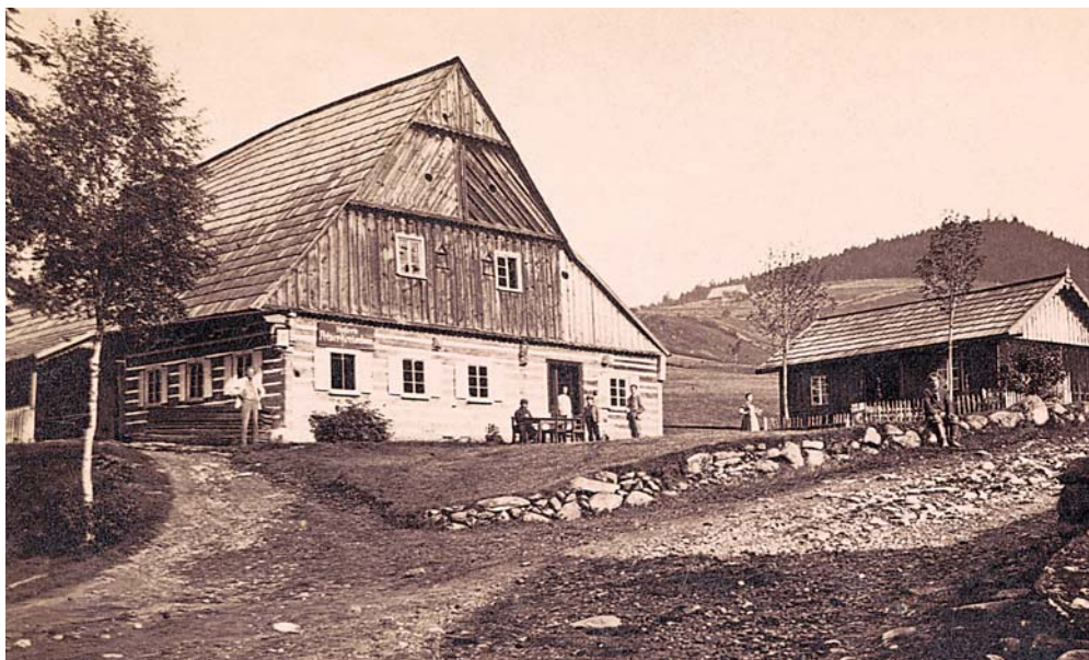
R. Halm: Hoferův hostinec v Peci, 1874–1879, vizitka. (Archiv P. Scheuflera.)

Zkoumání prvních místně usdlých fotografů v jednotlivých centrech krkonošského regionu není ještě ukončeno. Jistě však šlo o dlouhodobější proces od 60. let 19. století po počátek století dvacátého. Zřízení stálého portrétního ateliéru bylo vždy svázáno se zájmem a možnostmi klientely v daném místě, přičemž v Krkonoších byla zřejmá souvislost s rozmachem turistiky. Proto také se mnoho fotografů v regionu vedle portrétní práce soustředilo na místopisnou fotografii, i když