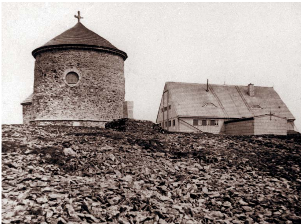
H. Krone: Vrchol Sněžky, 1863–1866, polovina stereofotografie. (Museum Ludwig, Köln.)

Na rozdíl od Šumavy, kde je nejstarší fotografie přesně datovatelná (jedná se o záběr z Volar po velkém požáru roku 1863), nelze zřejmě o nejstarším snímku Krkonoš jednoznačně rozhodnout. Pravděpodobně jej však bude nutno hledat buď mezi snímky Francouze Adolpha Brauna, nebo v souborech vatislavského rodáka Herrmana Kroneho. V každém případě patří oba autoři nejstarších dochovaných snímků Krkonoš mezi významné osobnosti evropské fotografie. Braun se narodil v roce 1812 v Besancon. V roce 1850 si otevřel fotoateliér v Dornachu