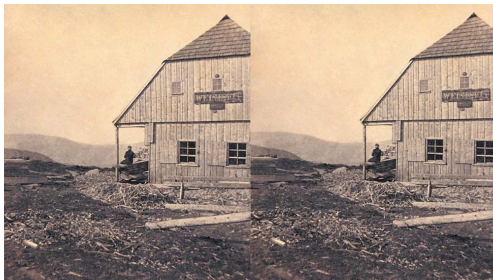
A. Braun: Obří bouda, stereofotografie, 1858–1862. (Museum Ludwig, Köln.)

Zmínka o snímcích Českosaského Švýcarska v souvislosti s Krkonošemi má svůj důvod. Tamní pískovcové skály patřily k vyhledávaným motivům fotografů z celé Evropy