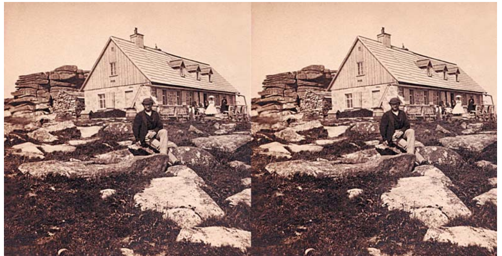
Bouda u Sněžných jam se skálou Krakonošova kazatelna, kolem 1880, stereofotografie.