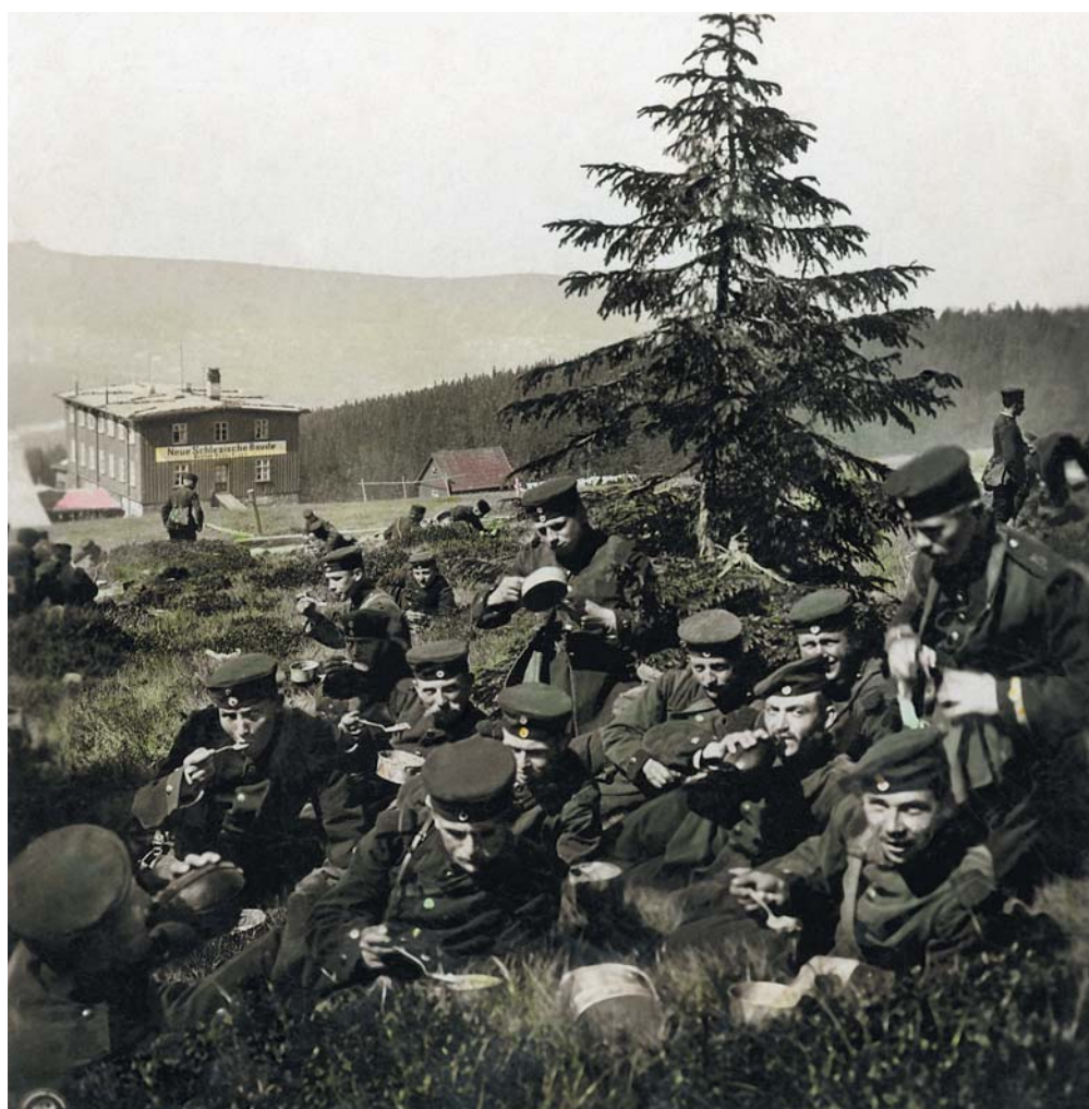
Neue Photographische Gesellschaft: Skupina pruských borských myslivců poblíž Nové Slezské boudy, s popiskou „Die 5. Jäger im Bivak“, kolem 1905, polovina kolorované stereofotografie.